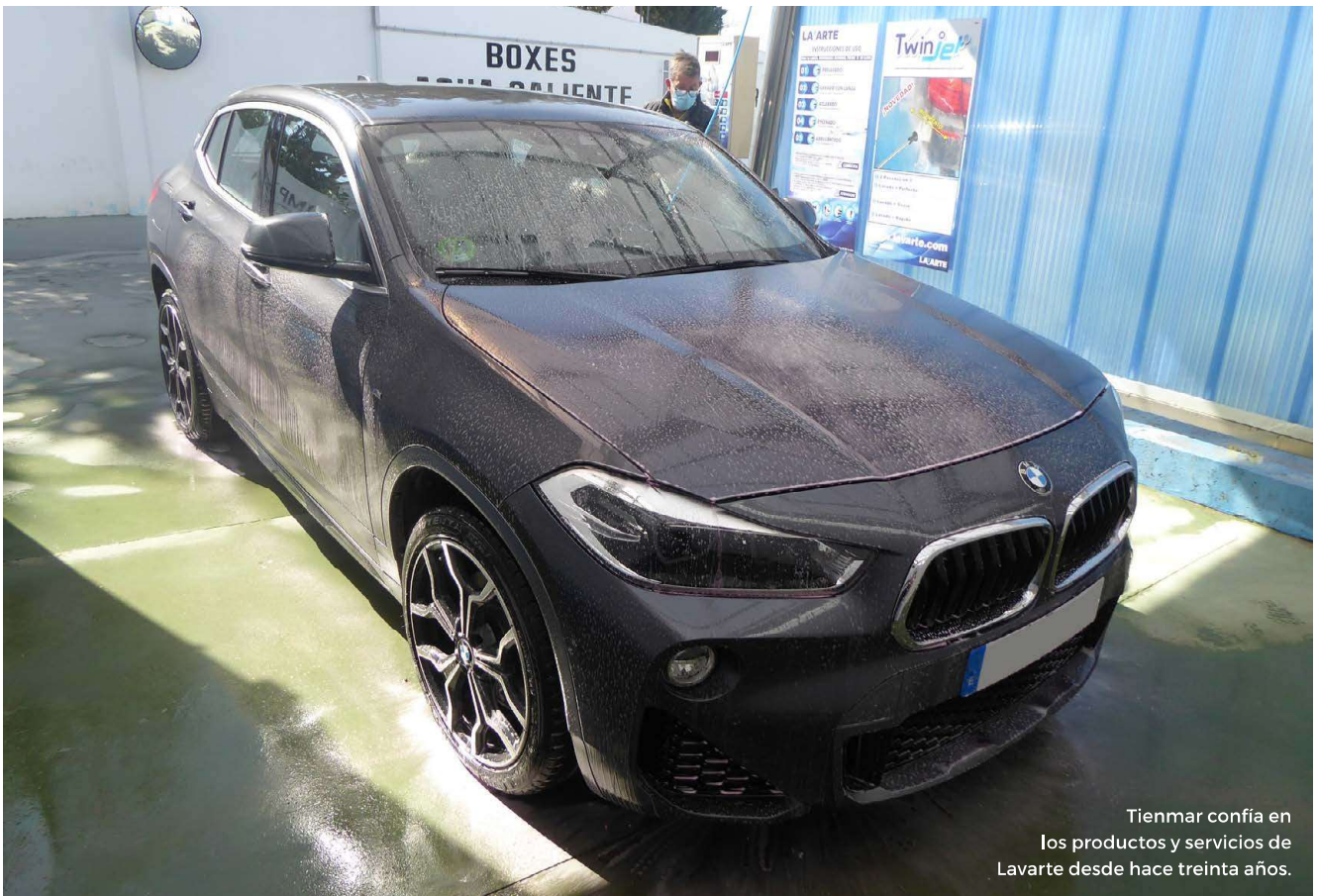
Tienmar confía en los productos y servicios de Lavarte desde hace treinta años.