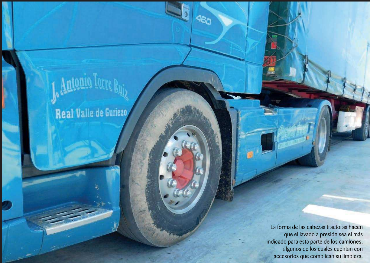
La forma de las cabezas tractoras hacen que el lavado a presión sea el más indicado para esta parte de los camiones, algunos de los cuales cuentan con accesorios que complican su limpieza.

En cuanto a la labor de ingeniería, “ha sido importante, puesto que hemos tenido que encajar los deseos de la propiedad con las necesidades técnicas. Al final hemos logrado un equilibrio del que estamos muy orgullosos. Por otra parte, tal y como sucede tristemente en tantas ocasiones, las licencias han retrasado la puesta en marcha de los equipos. Y en el momento en que se otorgaron todos los permisos las obras avanzaron a muy buen ritmo. De hecho, en dos meses y medio la instalación ya estaba en marcha”, concreta