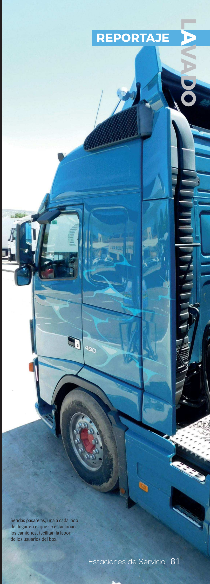
Sendas pasarelas, una a cada lado del lugar en el que se estacionan los camiones, facilitan la labor de los usuarios del box.

El perfil medio de los transportistas que acuden al área de servicio es variado, pero predominan los autónomos. No obstante, detalla Díaz, "hay empresas que cuentan con flota de camiones con las que hemos alcanzado acuerdos para que sus conductores asalariados puedan lavar los vehículos mediante fichas. La empresa adquiere las fichas y posteriormente las distribuye entre sus conductores. A nivel adm-