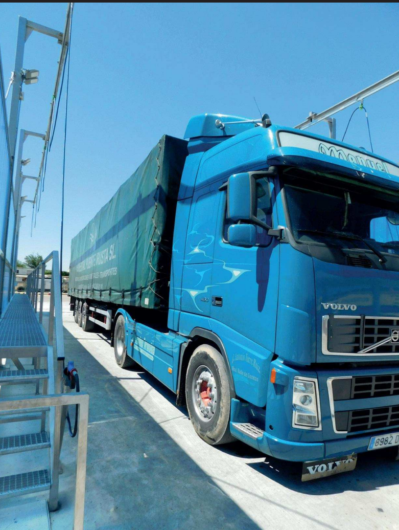
El área de servicio ‘La Joyosa’ está ubicada en una vía, la A 68, con un elevado tráfico pesado. Con la incorporación del box de Lavarte a su oferta de servicio, se diferencia de las numerosas estaciones de servicio de la zona.