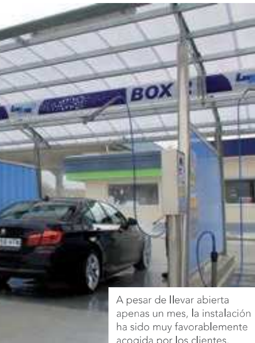
A pesar de llevar abierta apenas un mes, la instalación ha sido muy favorablemente acogida por los clientes.