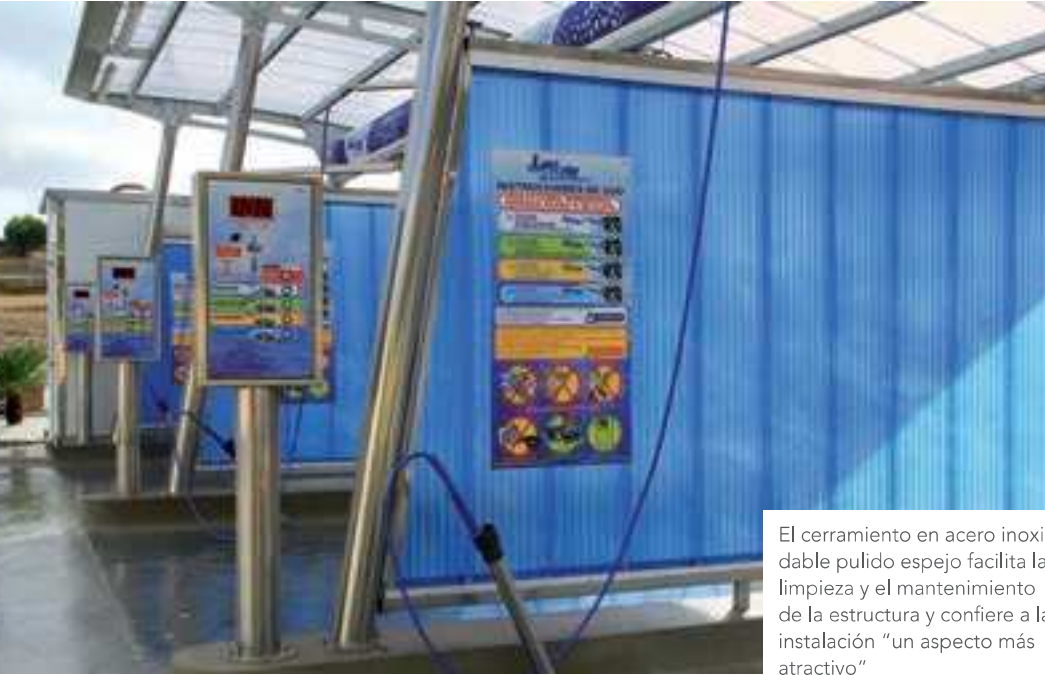
El cerramiento en acero inoxidable pulido espejo facilita la limpieza y el mantenimiento de la estructura y confiere a la instalación "un aspecto más atractivo"