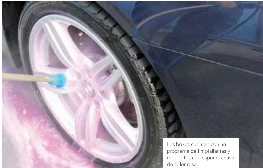
Los boxes cuentan con un programa de limpiavientos y mosquitos con espuma activa de color rosa.

do como original de la compañía, en acero inoxidable pulido espejo, lo que además de facilitar la limpieza y el mantenimiento de la estructura confiere a la instalación "un aspecto más atractivo". La instalación cuenta, asimismo, con "monederos de gran formato con indicadores de crédito, pulsadores piezoeléctricos y muchas opciones más".