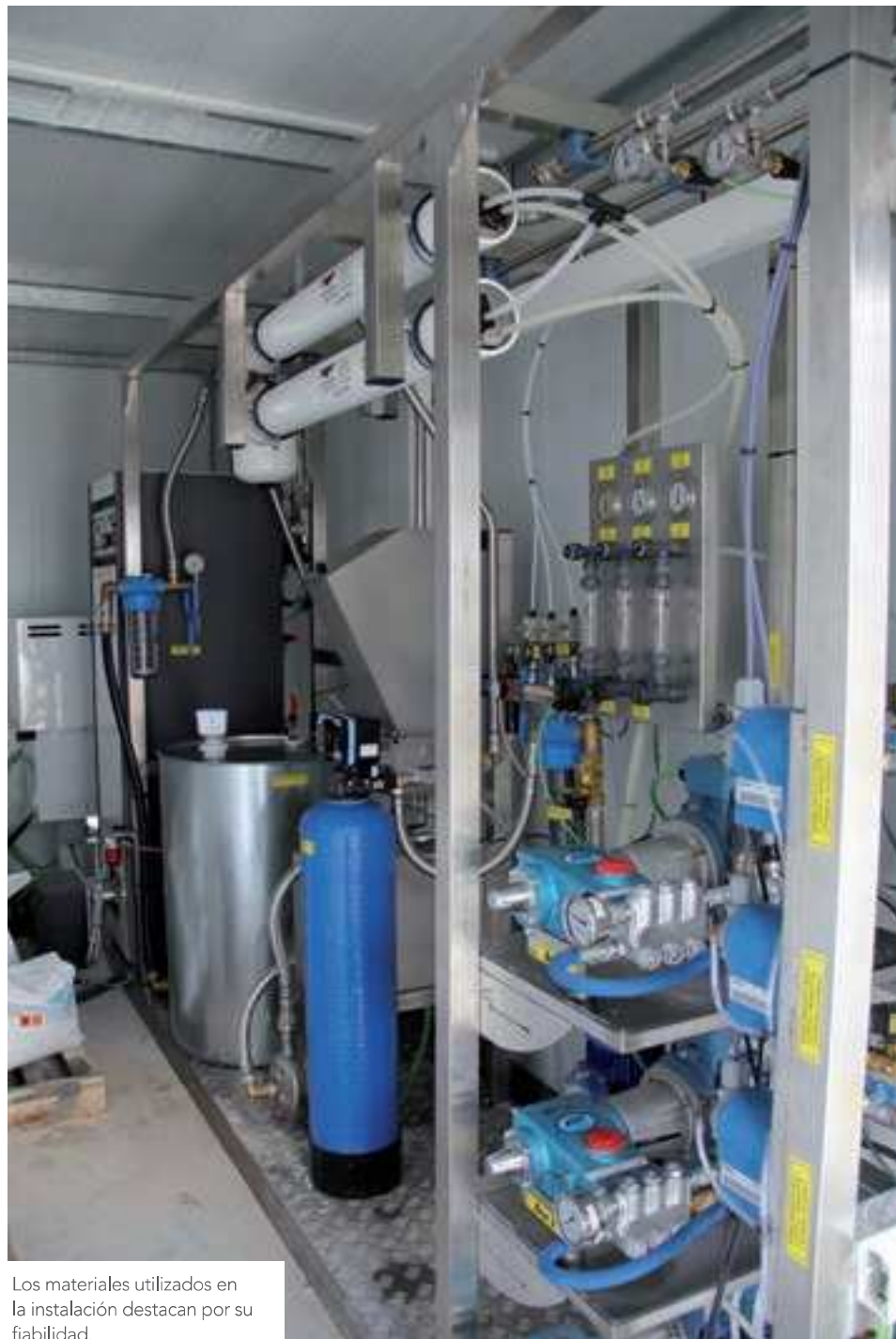
Los materiales utilizados en la instalación destacan por su fiabilidad.

iguales. En este sentido, desde Lavarte explican que a la hora de poner en marcha una instalación, “la primera premisa en una máquina es la fiabilidad”, por lo que la compañía “no aborda ninguna opción o sistema que no garantice este requisito”. Para garantizar la calidad de los productos que se instalarán en el área de lavado,